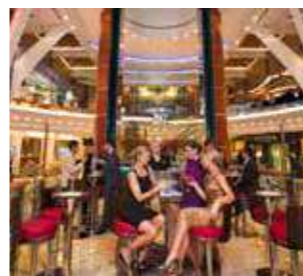
ライジングタイドバー

上下に移動し、動く風景と一緒に飲み物が楽しめる「ライジングタイドバー」をはじめ、多数のラウンジやバーがあります。