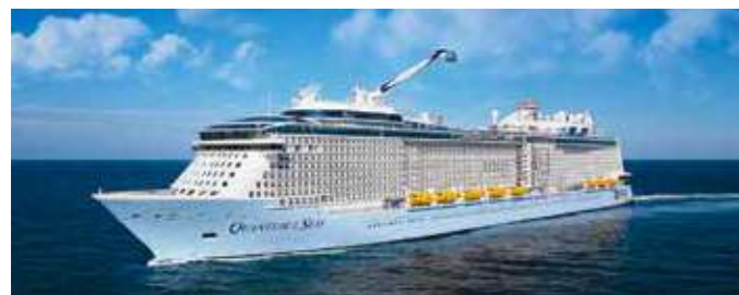
クワンタムクラス Odyssey of the Seas OY オデッセイ 2020年7月就航 167,704トン Spectrum of the Seas SC スペクトラム 2019年4月就航 169,379トン Ovation of the Seas OV オペーション 2016年4月就航 168,666トン Anthem of the Seas AN アンセム 2015年4月就航 168,666トン Quantum of the Seas QN クワンタム 2014年11月就航 168,666トン