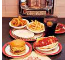
ジョニーロケッツ (ハンバーガー)