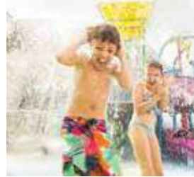
スプラッシュ アウェイベイ (子供用プール)