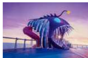
アルティメットアビス(スライダー)

オアシスクラスの客船では「CATS」「マンマ・ミーア」「ヘアスプレー」など様々な賞を受賞したことのあるブロードウェイショーをフル上演! ※演目は客船によって異なります。