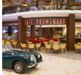
カフェフロムナード (無料のカフェ)