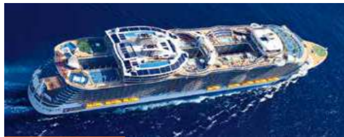
オアシスクラス Utopia of the Seas UT ユトピア 2024年7月就航予定 236,860トン Wonder of the Seas WN ワンダー 2022年3月就航 236,857トン Symphony of the Seas SY シンフォニー 2018年4月就航 228,081トン Harmony of the Seas HM ハーモニー 2016年5月就航 226,963トン Allure of the Seas AL アリュール 2010年12月就航、2020年5月改装 225,282トン Oasis of the Seas OA オアシス 2009年12月就航、2019年11月改装 225,282トン