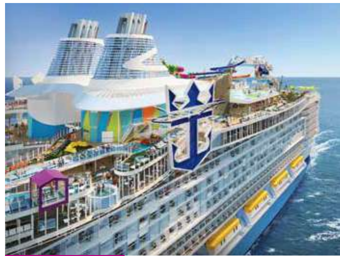
世界最大客船 アイコンクラス NEW Icon of the Seas IC アイコン・オブ・ザ・シーズ 2024年1月就航 250,800トン

ロイヤル・カリビアン・インターナショナルはさまざまな船上初の施設を生み出してきたクルーズ業界をリードする革新的な船会社です。創業54年、保有の28隻の船が6大陸、72か国、270の寄港地をご案内します。