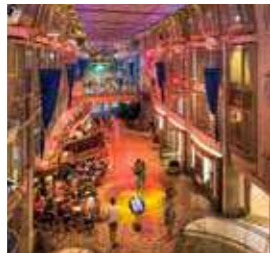
ロイヤルプロムナード