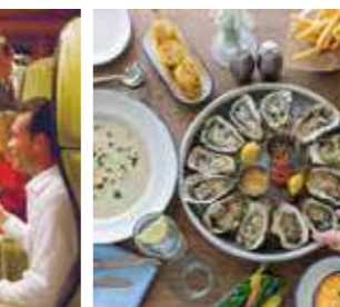
フックドシーフード[ワンダー/シンフォニー]

船内には無料でフルコースを召し上げられる優雅なメインダイニングルームをはじめ、イタリアンや日本食などの専門店、カジュアルなビュッフェや気軽に立ち寄れるカフェなどバラエティに富んでおり、まさに「グルメシップ」。その時の気分に合わせてご利用いただけます。