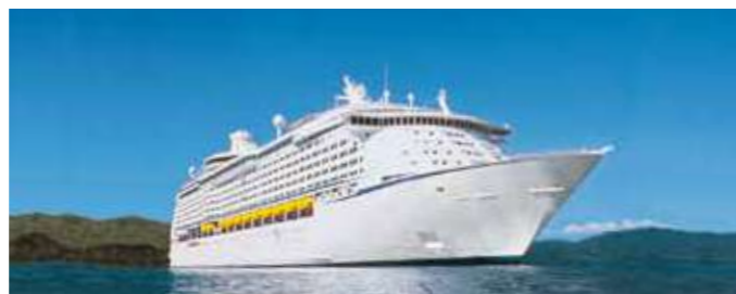
ボイジャークラス Mariner of the Seas MA マリナー 2003年11月就航、2018年5月改装 139,863トン Navigator of the Seas NV ナビゲーター 2002年12月就航、2019年2月改装 139,999トン Adventure of the Seas AD アドベンチャー 2001年11月就航、2016年10月改装 137,276トン Explorer of the Seas EX エクスプローラー 2000年10月就航、2020年5月改装 137,308トン Voyager of the Seas VY ボイジャー 1999年11月就航、2019年11月改装 137,276トン