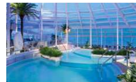
ソラリウム [大人専用プール]

驚きにあふれる創作料理が楽しめる「ワンダーランド」やおしゃれなイタリアンなど個性的なレストランやスタイリッシュなカフェが多数揃っています。