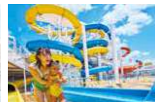
パーフェクトストーム(ウォータースライダー)

10デッキ分の高さから急降下するスライダー「アルティメットアビス」をはじめ、9デッキの高さを約25m空中滑走する「ジップライン」などスリルと興奮のアクティビティが充実。ロイヤル・カリビアンならではの楽しさを満喫してください。