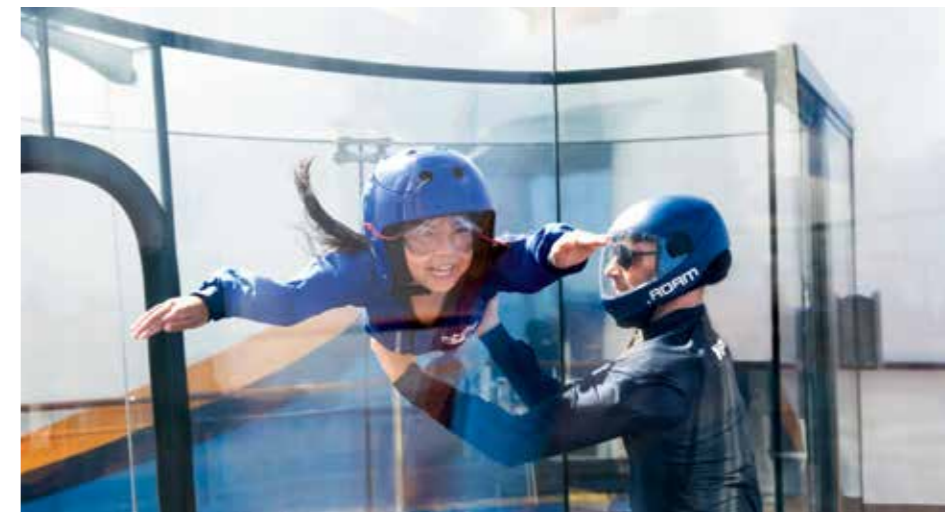
アイフライ 洋上初となるスカイダイビング・シミュレーター

洋上初のロボットバーテンダーがいる「バイオニックバー」やワインの品揃えが豊富な落ち着いた雰囲気のリバーなどバー&ラウンジも充実しています。