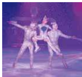
アイススケートショー