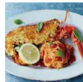
ジェイミズイタリアン [スペクトラム/アンセム/クワンタム]