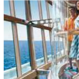
ガラスのエレベーター