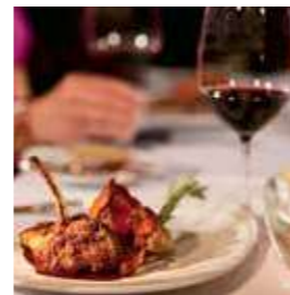
チョップスグリル (ステーキハウス)