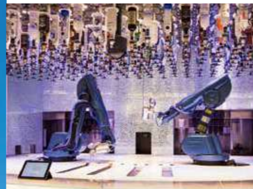
バイオニックバー

ギネス記録にも認定された、海上90mの景色が楽しめる展望カプセルをはじめ、「洋上初」が満載の客船で新時代のクルーズをお楽しみください。