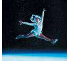
アイススケートショー