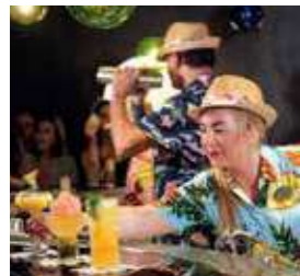
ザ・バンブルーム (ポリネシアンバー) [マリナー/ナビゲーター]