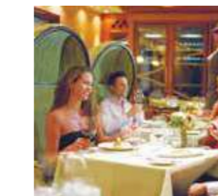
150セントラルパーク

上下に移動し、動く風景と一緒に飲み物が楽しめる「ライジングタイドバー」をはじめ、多数のラウンジやバーがあります。