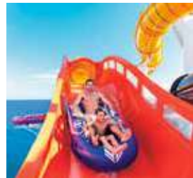
ザ・フラスター (ウォータースライダー) [ナビゲーター]