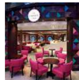
ラ・パティスリー [オデッセイ以外]

驚きにあふれる創作料理が楽しめる「ワンダーランド」やおしゃれなイタリアンなど個性的なレストランやスタイリッシュなカフェが多数揃っています。