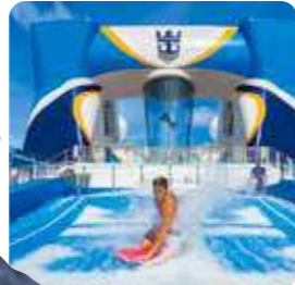
フローライダー (サーフィン)