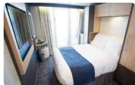
スタジオ・バルコニー