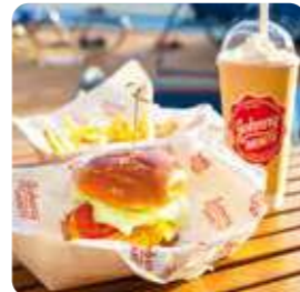
ジョニー・ロケッツ (ハンバーガー)