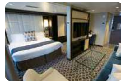
グランドスイート