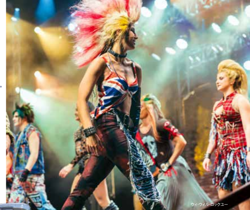
ウィ・ウィル・ロックユー