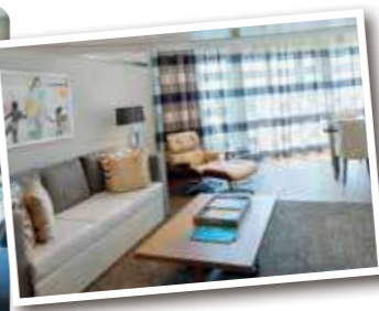
オーナーズスイート