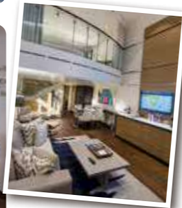
スカイロフトスイート