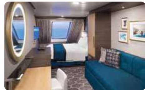
スーパーリア海側