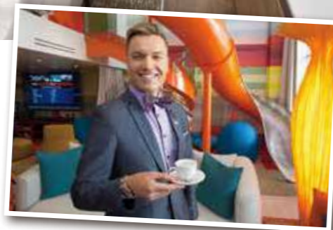
ロイヤルジュニア

スイートクラスは客室も広くゆったりとクルーズをお楽しみいただけます。専用ラウンジもあり、3つのランク別にさまざまな特典が付きま。また一部のカテゴリーは5-8名定員で、ご家族旅行に最適です。