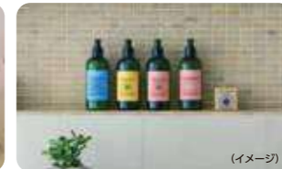
アメニティ (イメージ)