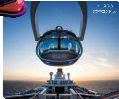
ノースター (空中ゴンドラ)