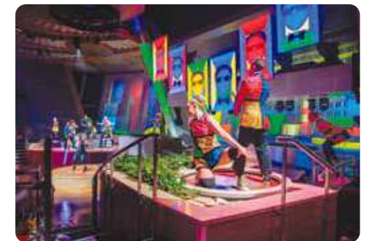
トゥセプンティショー (スペクトラスキャパー)