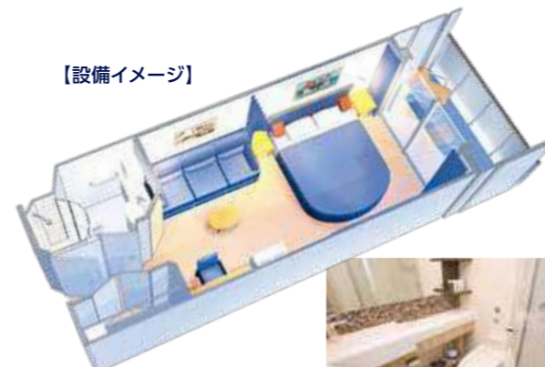
バルコニー客室例