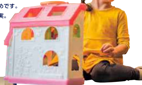
アドベンチャーオーシャン (児童館)