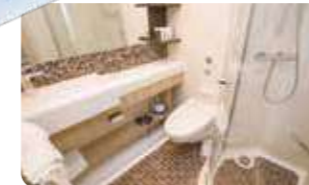
洗面・シャワールーム