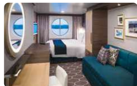
スタンダード海側