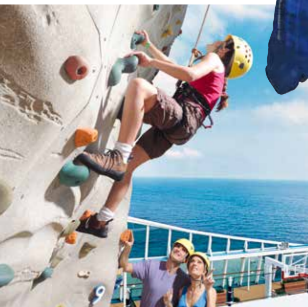
ロッククライミング