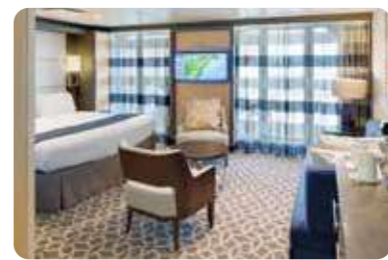
ジュニアスイート