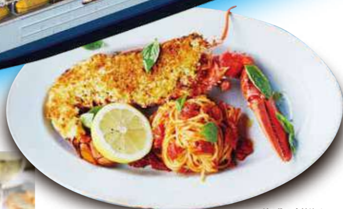
ジェイミーズイタリアン