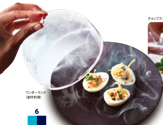
ワンダーランド (創作料理)

摩訶不思議な創作料理やロボットバーテンダーまで、個性的な飲食店がズラリ。ステーキハウス、著名シェフが手がけるイタリアン、レトロな雰囲気ハンバーガーショップ、深夜までオープンしているピザハウスなどバリエーションも豊かです。