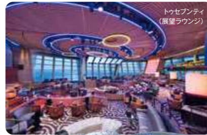
トゥセプンティ (展望ラウンジ)