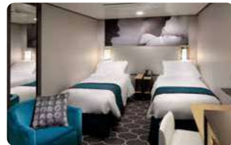
スタンダード内側