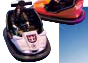
シープレックス&バンパーカー