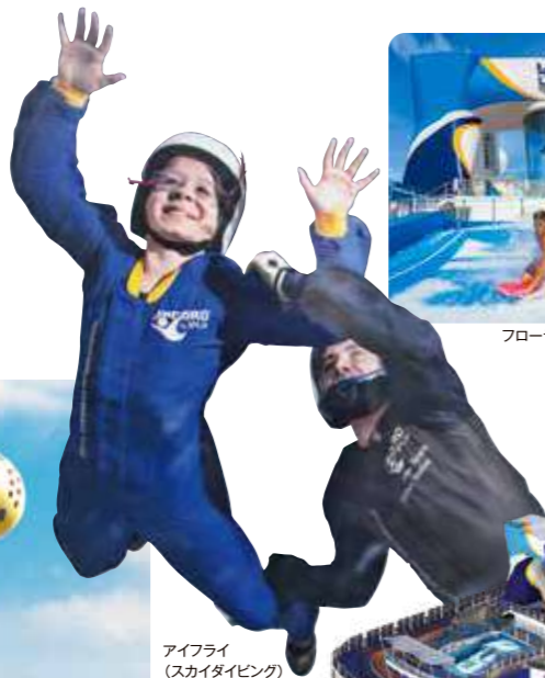
アイフライ (スカイダイビング)

スカイダイビングに空中ゴンドラ、バンパーカーなど、大興奮のアミューズメントが盛りだくさん!