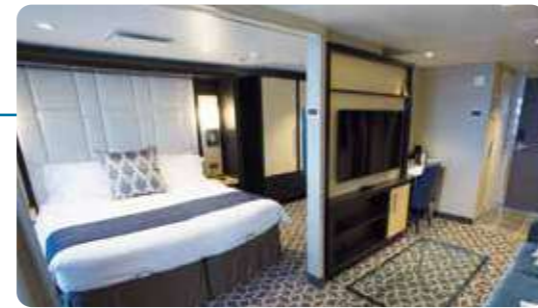
グランドロフトスイート