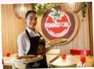
PIZZERIA PUMMIDORO (有料)