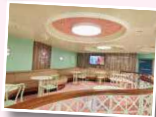
AMARILLO GELATERIA (有料)