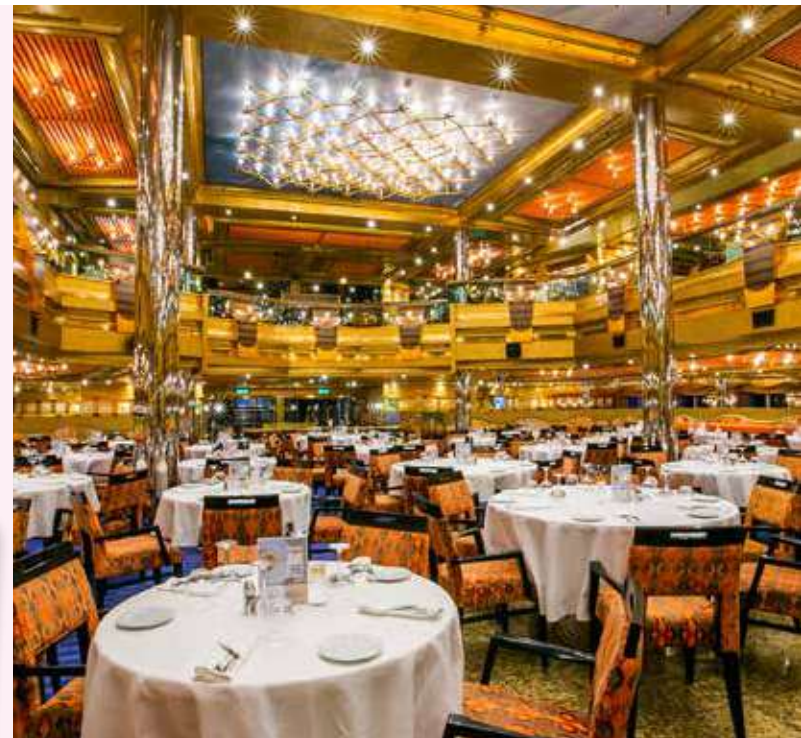
メインダイニング アラカルトのコース料理となります。