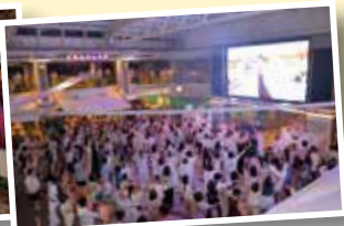
夜はホワイトパーティーへ