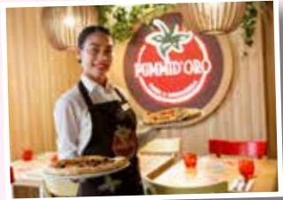
PIZZERIA PUMMIDORO (有料)