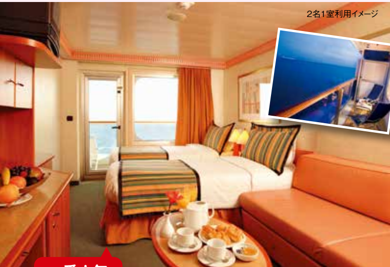
2名1室利用イメージ