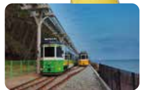
海雲台ブルーライン

【行程】港出発 ▶▶▶ 甘川文化村 ▶▶▶ 龍頭山公園 ▶▶▶ 釜山タワー ▶▶▶ 港到着