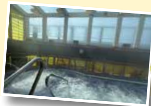
スパ(有料)でゆったりくつろぎタイム