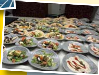
目移りするビュッフェメニュー