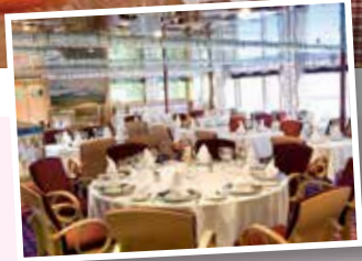
CASANOVA (有料) 特別なワンランク上のレストランで、 ゆっくりお楽しみください。