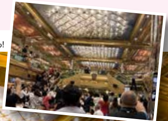
レストランクルーによるショーも!