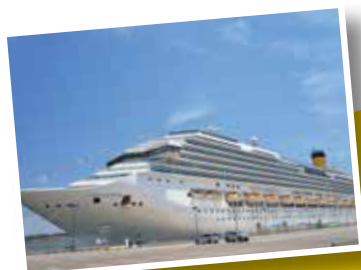
大迫力のコスタセレーナ

コンセプトは「海の上のイタリア」。コスタクルーズはイタリア生まれのクルーズ船。同室3-4名様目の 12歳未満のお子様2名まで無料 など、家族旅行にもおすすめ。料金も格安で気軽でカジュアルです。また金沢発着コスタクルーズ史上最大客船のコスタセレーナで、非日常の洋上体験と発見の旅をお楽しみください。