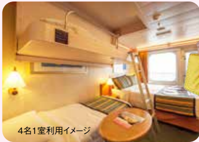
4名1室利用イメージ