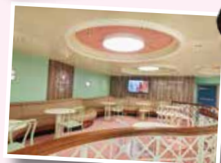
AMARILLO GELATERIA (有料)