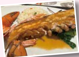
メインレストランメニューの一例