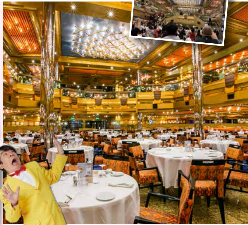
メインダイニング アラカルトのコース料理となります。