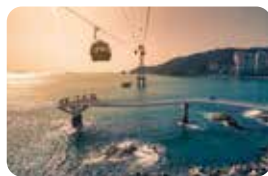
松島海上ケーブルカー

海に面した美しい「海東龍宮寺」、韓国最大の海鮮市場「チャガルチ市場」の王道スポットの他に、韓国のマチュピチュと言われるカラフルな「甘川文化村」で街散策や、「松島海上ケーブルカー」で上空散歩を楽しんだり、車窓に大海原が広がる観光列車が走る「海雲台ブルーライン」も人気です。