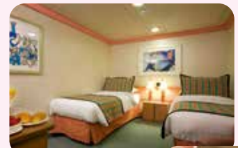
2名1室利用イメージ