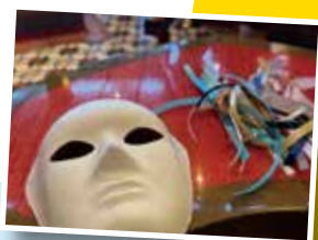
仮面制作して夜の仮面パーティーへ