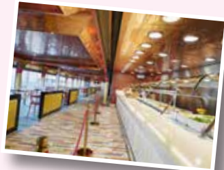
ピュッフェコーナー お好きな時間に自由に 気軽にお食事が出来ます。