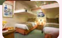
4名1室利用イメージ