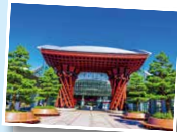
アクセス抜群の金沢駅 (乗下船日は有料シャトルバス運行)